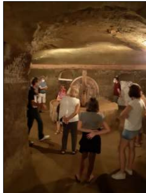
Visite exceptionnelle du moulin à huile pour les journées du Patrimoine