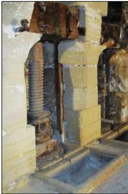
Exemple de pressoir à chapelle (moulin du Barroux)

En général dans une structure troglodyte on utilise un pressoir à vis dont le montant est encastré dans la muraille ce qui permet de contenir les efforts à moindre frais, un tel pressoir est dit pressoir à chapelle .