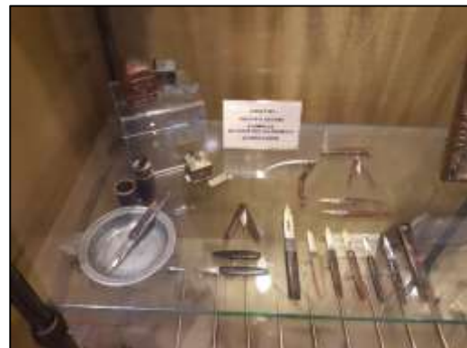
Outils à saigner

Association « Cairanne et son vieux village »