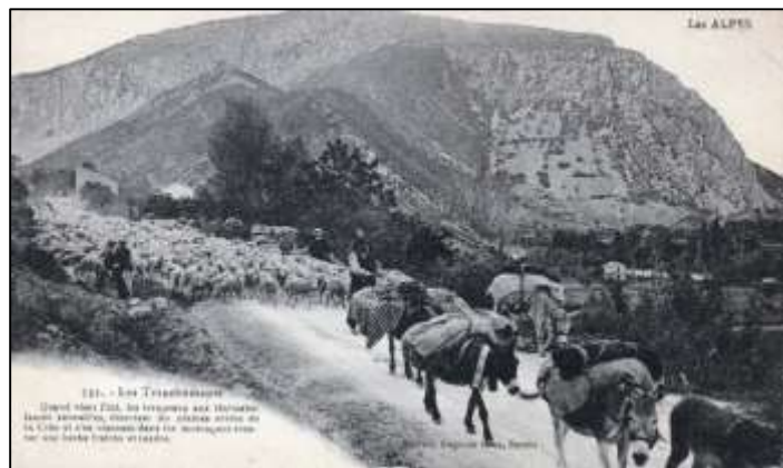
Source : association ...ces long troupeaux de moutons avec des ânes...

Il y avait une curiosité encore plus grande que la transhumance des moutons, c'était quand un cycliste