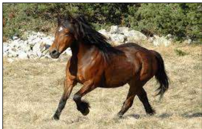
Un barraquand