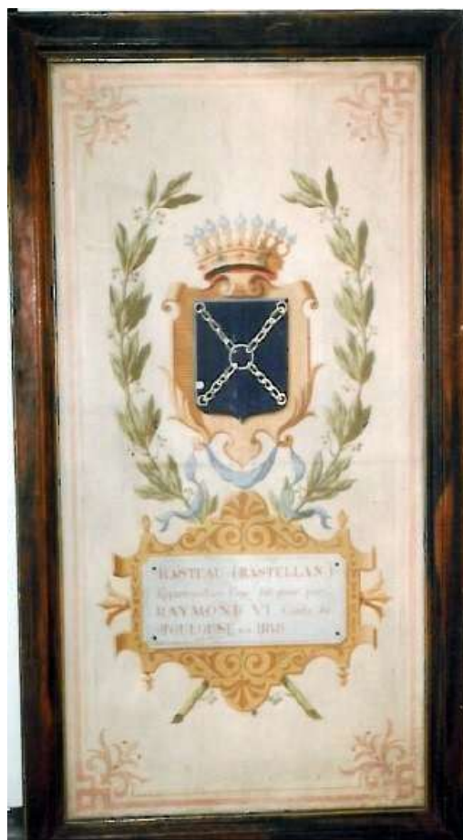
Tableau représentant le blason de Rasteau (XIX e )

Rasteau s'exécute en présentant celui qui se trouve sur notre fameux tableau, validé par le Conseil Municipal de l'époque (cependant toujours aucune trace dans les comptes rendus des conseils municipaux). Notre blason a donc été définitivement choisi avec juste raison et officialisé.