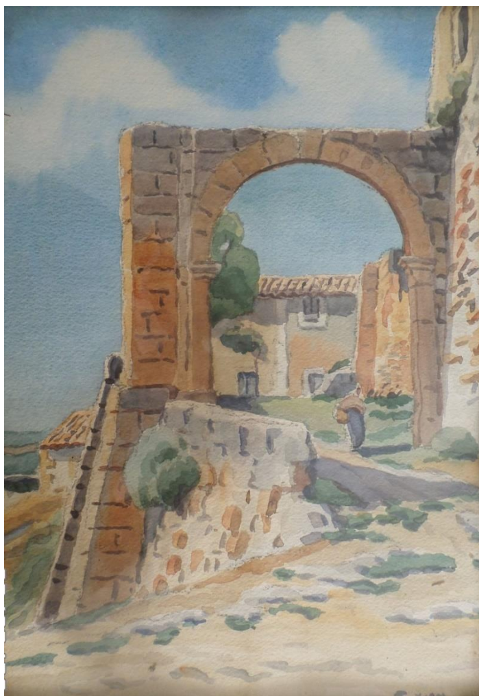
La maison de Marius Constant avant la guerre. Aquarelle de Yvan