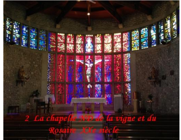
2 La chapelle ND de la vigne et du Rosaire XIXe siècle