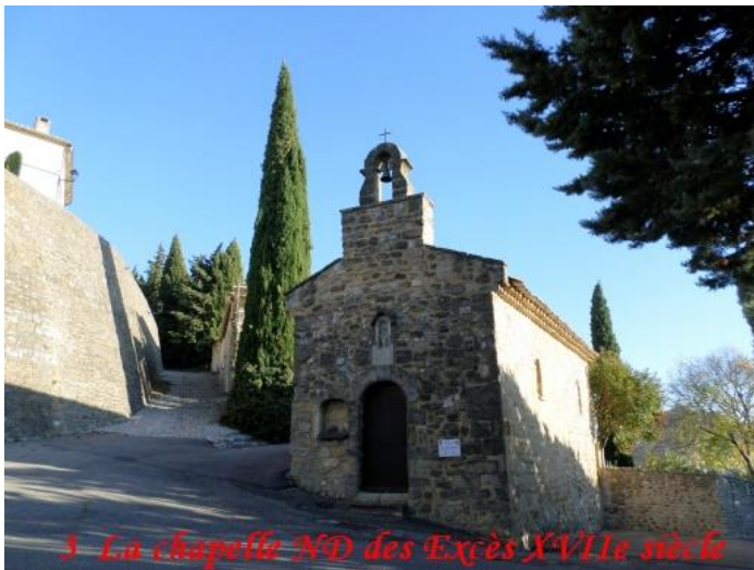
3 La chapelle ND des Excès XVIIe siècle