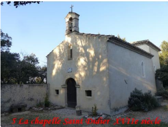
5 La chapelle Saint Audier XVIIIe siècle