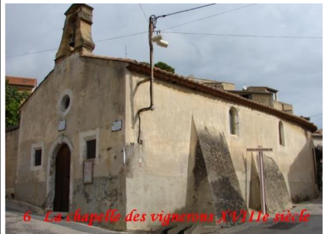
6 La chapelle des vignerons XVIIIe siècle