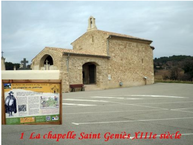
1 La chapelle Saint Geniès XIIIe siècle