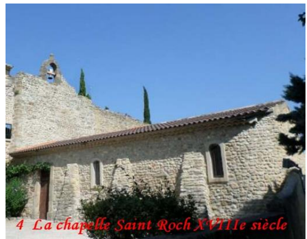
4 La chapelle Saint Roch XVIIIe siècle